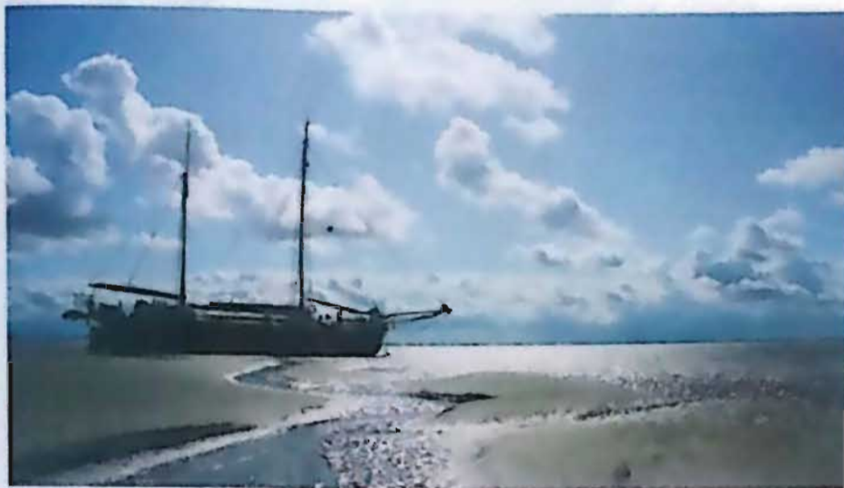
Die „Veränderung“ dient als Klassenraum für das Wetterseminar.